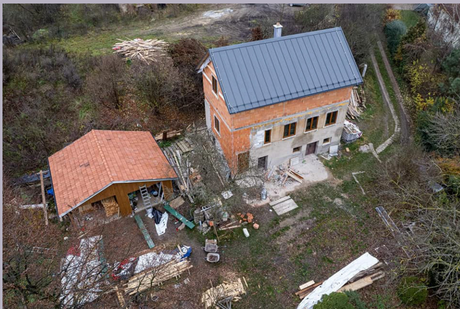
Stavba klubovny ve Velkém Meziříčí.