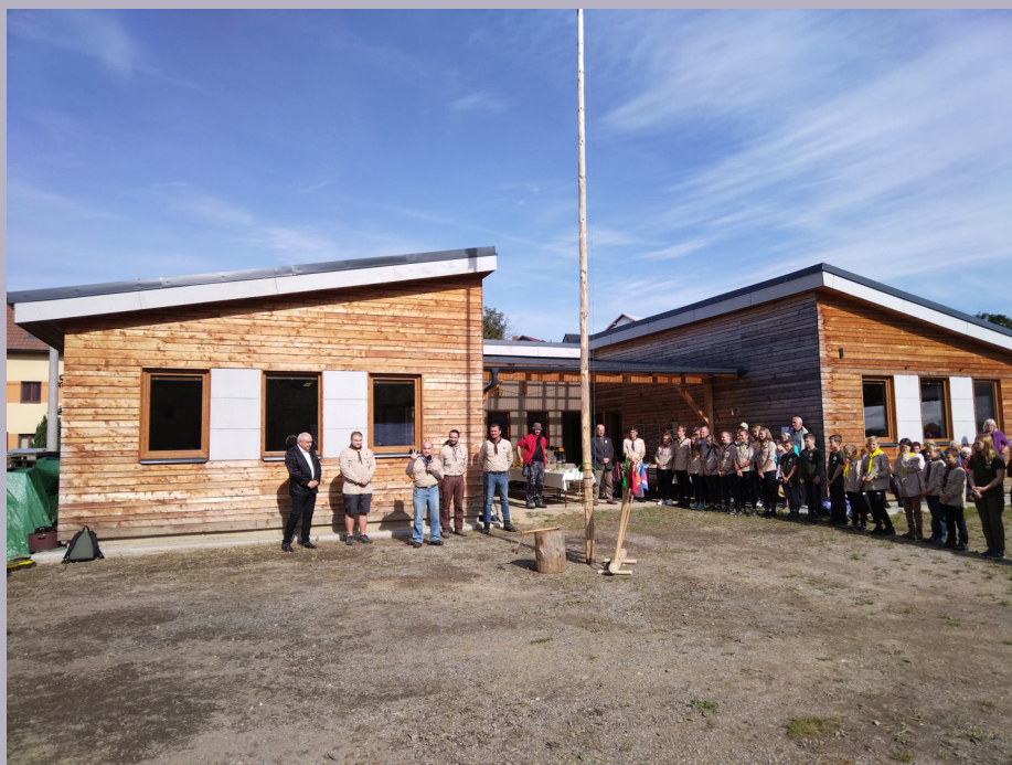
Nová klubovna v Polné.

S rostoucím zájmem o skautování je v posledních letech úzce spojena i potřeba dostatečné kapacity míst, kde můžou skautské oddíly působit. Řada skautských středisek na Vysočině se proto v posledních letech pustila do rekonstrukce stávající klubovny nebo i výstavby zcela nové klubovny. V řadě případů jim v tom pomáhá město, větší i menší dárci, dobrovolníci z řad rodičů, členů střediska i samotní členové oddílů. V tomto roce tak byly slavnostně otevřeny nové klubovny v Polné a Bystřici nad Pernštejnem. Na několika místech mají střediska klubovny rozestavěné nebo pracují na projektu.